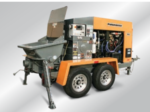
Serie Thom-Katt — Tier 4 Final