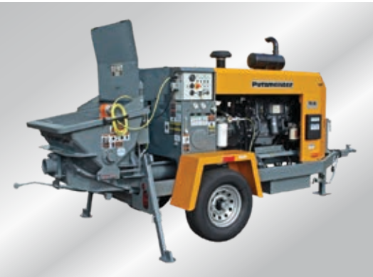
Serie Thom-Katt — Tier 3