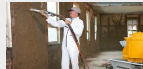
Enlucido de barro proyectado por pistola en interiores