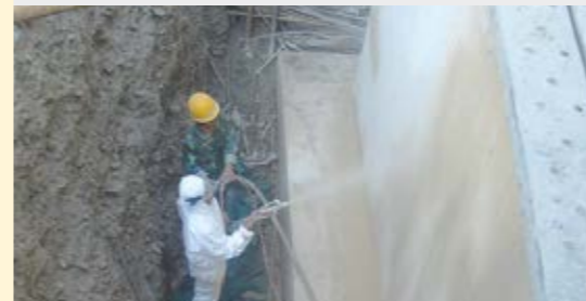
Revestimiento de cimientos de hormigón