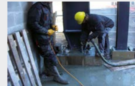
Rellenado de columnas de acero