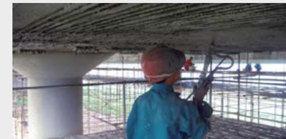
Saneamiento de puentes